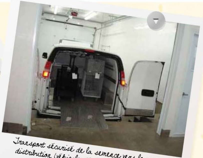
Transport sécurisé de la semence vers le centre de distribution (véhicule dédié, contrôle de la chaîne de température à 16 degrés Celsius).