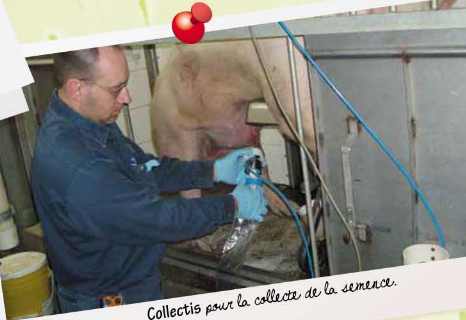
Collectis pour la collecte de la semence.