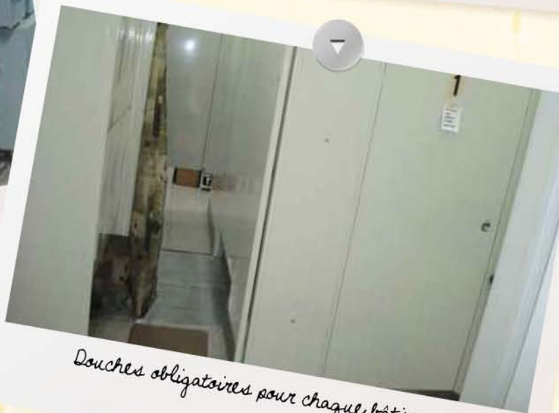
Douches obligatoires pour chaque bâtiment.