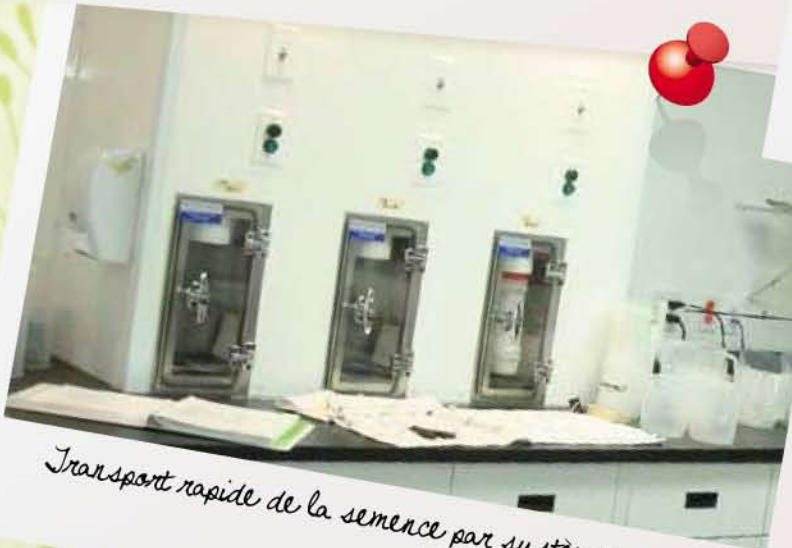
Transport rapide de la semence par système vacuum.