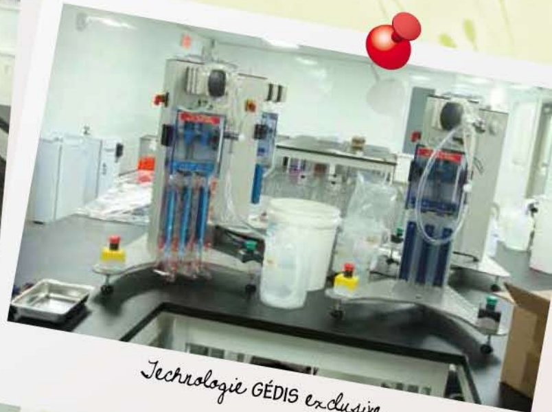
Technologie GÉDIS exclusive.