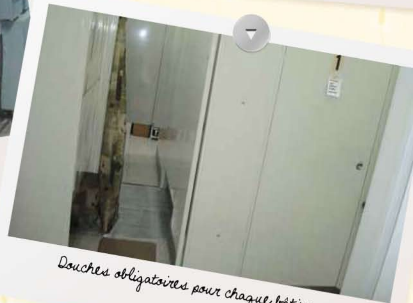
Douches obligatoires pour chaque bâtiment.