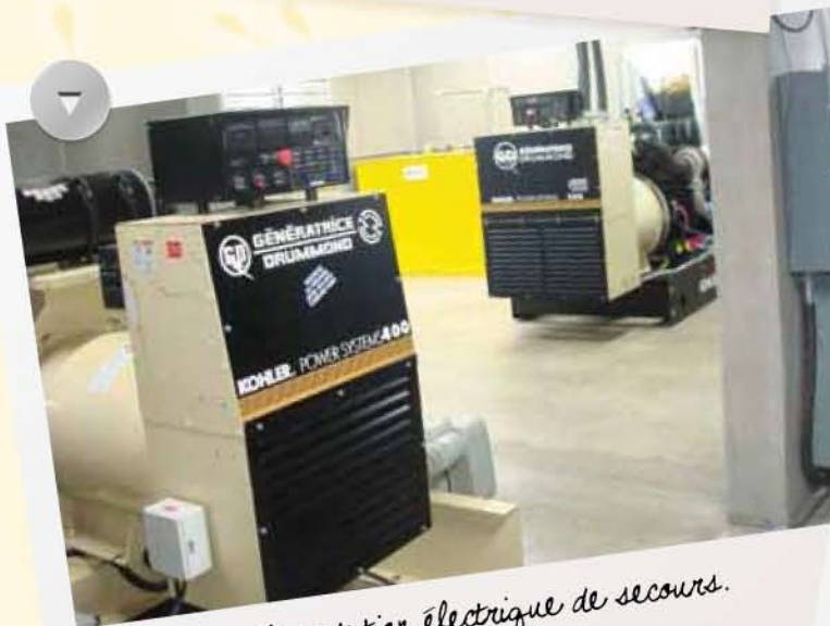
Alimentation électrique de secours.