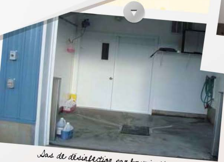
Sas de désinfection par brumisation au Virkon à l'entrée.