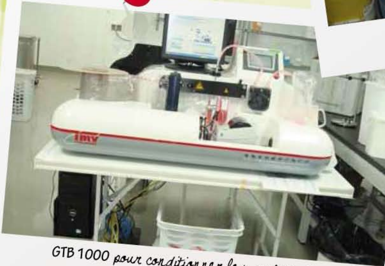
GTB 1000 pour conditionner les sachets GTB.