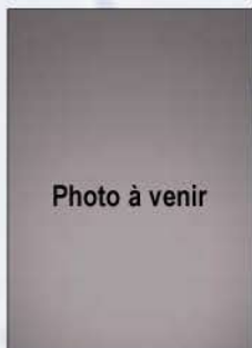
Cécilien Berthiaume FPPQ